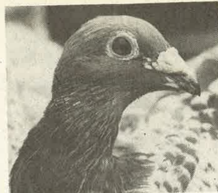
● De '086'.

Niet onvermeld mag blijven zijn prestaties